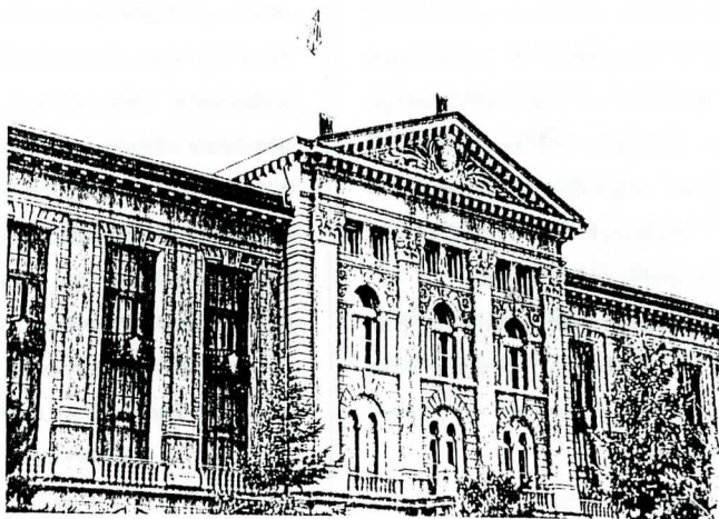
Budova Švajčiarskeho federálneho archívu v Berne