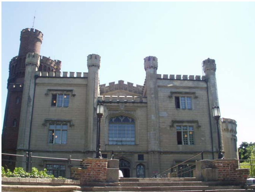
Knižnica v Kornickom zámku

dnes patrí poľskej akadémii vied. Obsahuje okolo 400 tisíc zväzkov, medzi nimi aj vzácne inkunábuly.