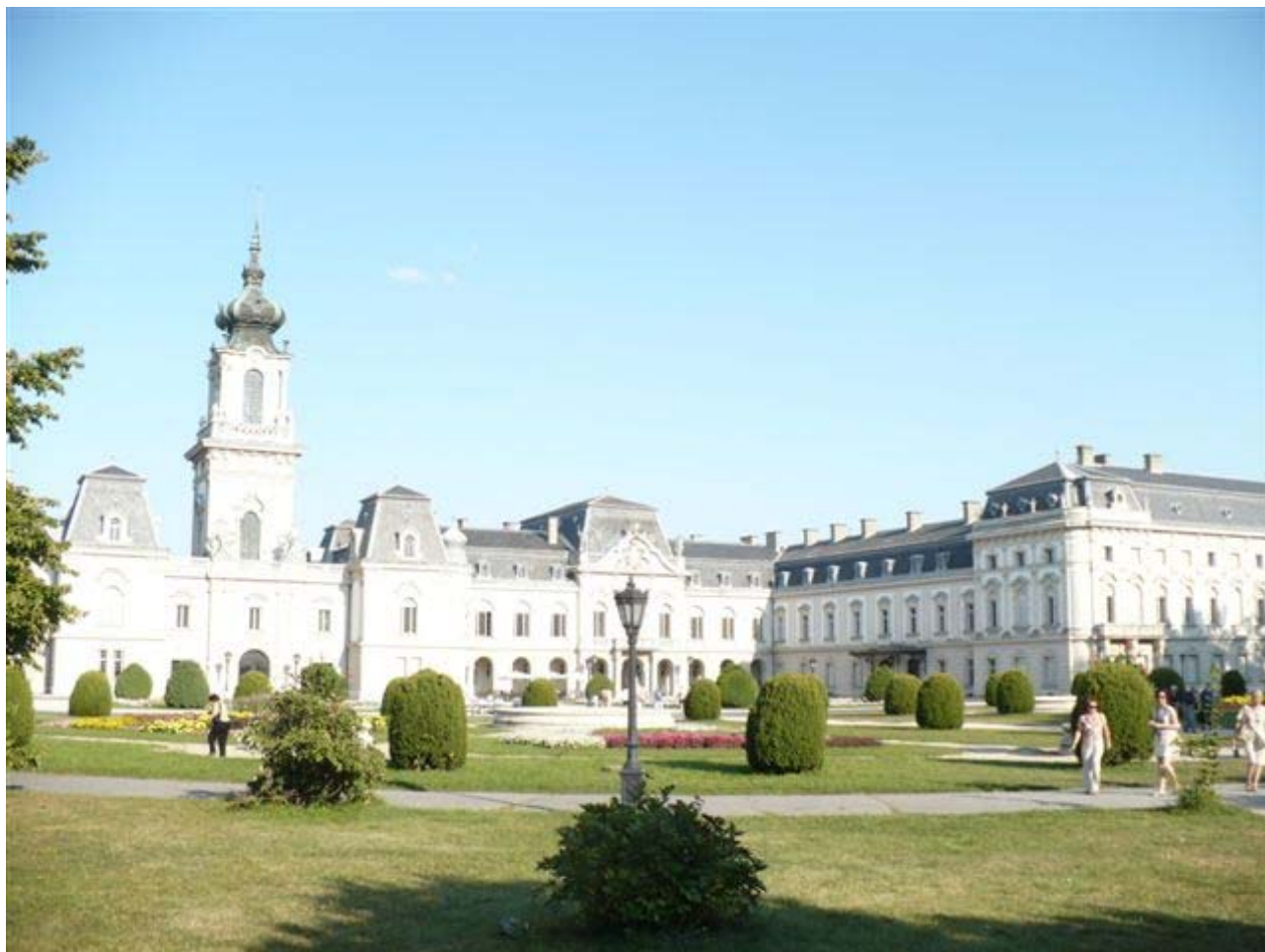
Pohľad z parku na centrálnu časť zámku a krídlo