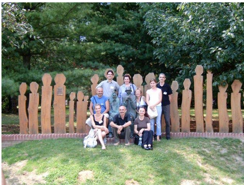
Zahranční účastníci pred vstupom do Goecsejského skanzenu v Zalaegerszegu