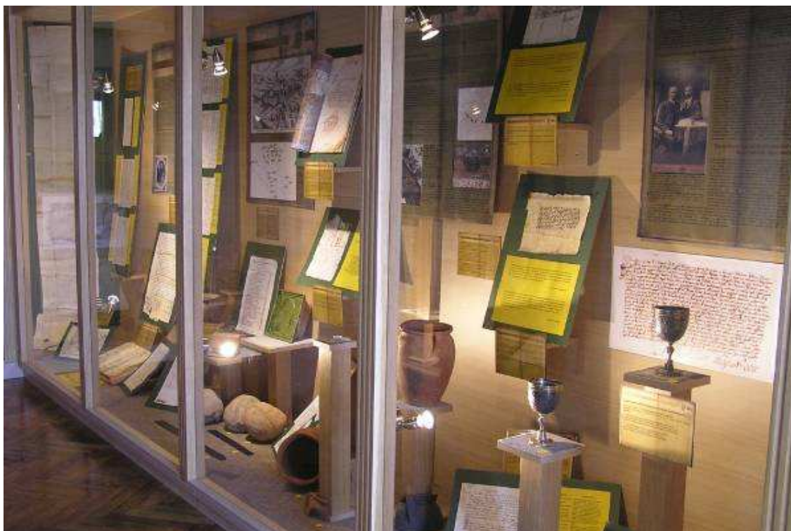
Časť expozície stredoveku a novoveku

Okrem stálych expozícií bola prístupná aj prvá krátkodobá výstava, ktorá vznikla v spolupráci so Slovenským národným archívom v Bratislave a návštevníkom predstavuje archívne dokumenty z archívneho fondu esterházyovského panstva Šintava – Čeklís. Expozície sú sprevádzané trojjazyčným textovým výkladom a mapovými zobrazeniami. Individuálni záujemcovia si výstavy môžu pozrieť počas návštevných hodín: v stredu až piatok (14 00 – 18 00 ), v sobotu (13 00 – 18 00 ).