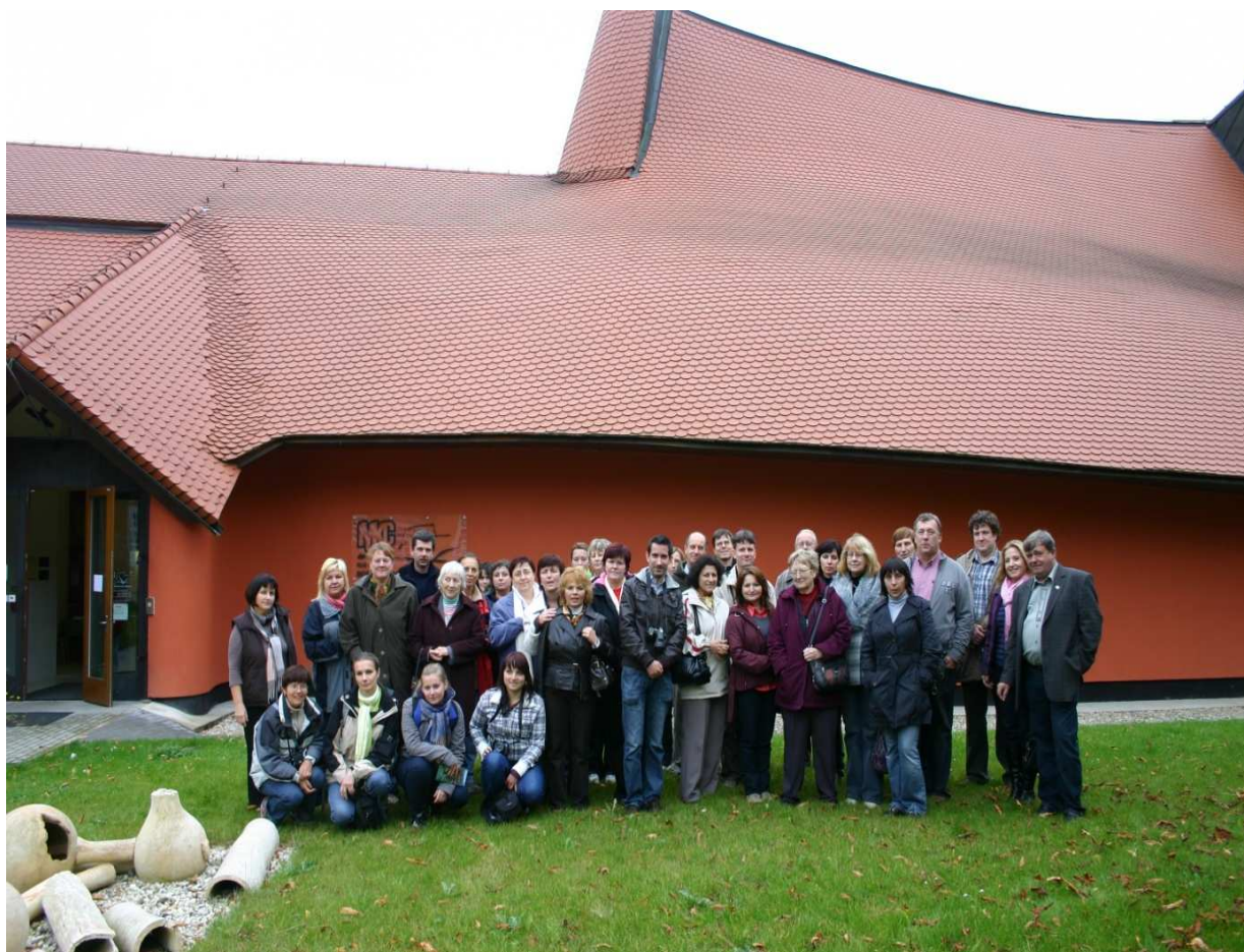
Účastníci exkurzie pred Moravským kartografickým centrom 5.10.2010.

v areáli miestneho barokového zámku, postavili ho na mieste krídla, ktoré vyhorelo v roku 1983. Ide o modernú stavbu, ktorá znázorňuje trup lode otočený kýlom dohora. Ústredným exponátom v centre je plastická mapa Moravy a Sliezska v mierke 1:25 000 dlhodobo zapožičaná z Moravského zemského archívu v Brne. Ide o stupňovitú reliéfnu mapu, tvorí ju 79 drevených dielov rôznej veľkosti, zaberá plochu 100 m 2 . Slúžila pre vojenské účely, zobrazuje stav v prírode približne spred 100 rokov. Ďalej sme videli geodetické a kartografické prístroje a pomôcky na výrobu máp, unikátne prístroje na kartografické a fotogrametrické spracovanie máp zo zbierok Národného technického muzea.